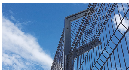
BAVOLET CORNIÈRE UNIVERSEL