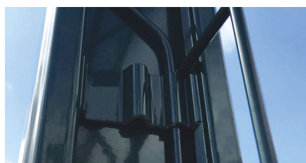
CLIP FIXATION POTEAU/PANNEAU