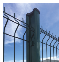
Poteau H alu 250