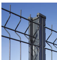
Poteau H à encoches