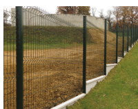
Montage en redan