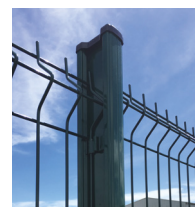
Poteau H alu 250