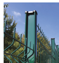
Poteau H alu 155